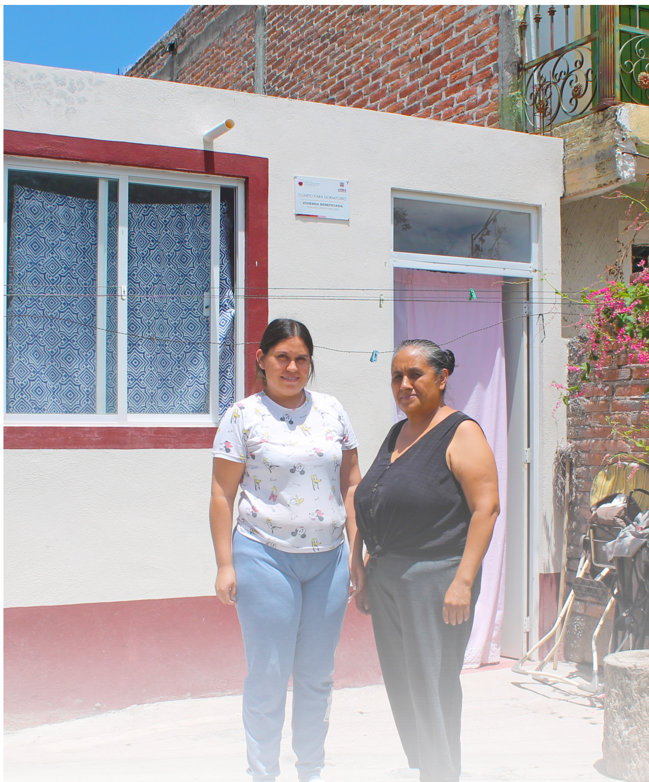
13. CONVENIO FISE -FISM-019-2022 DE FECHA 20 DE ABRIL DE 2022 EN MEJORAMIENTO A LA VIVIENDA CON UNA INVERSIÓN DE $ 2,250,000.00. ENTRE ESTADO Y MUNICIPIO, SIENDO LA APORTACIÓN MUNICIPAL $1,500,000.00 Y ESTADO $750,000.00. CONSISTE EN 1 CUARTO COCINA, 6 CUARTO DORMITORIO, 8 SANITARIOS, 28.75 M2 PISO FIRME, 471.87 M2 TECHO FIRME, BENEFICIANDO A 37 FAMILIAS.