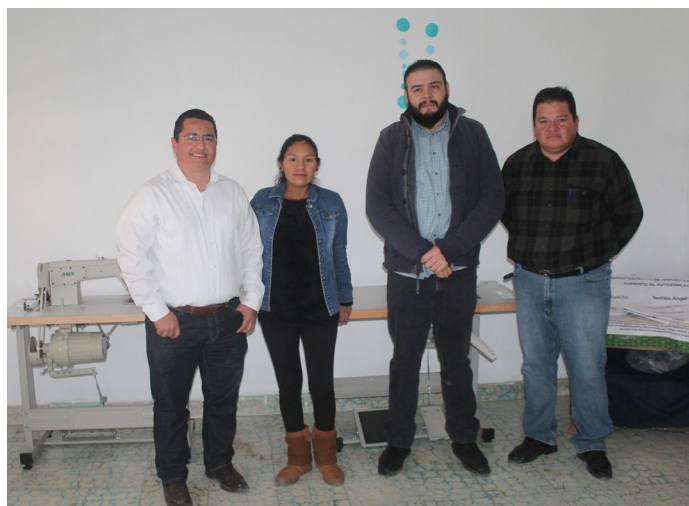
Foto: Apoyo a proyecto de autoempleo