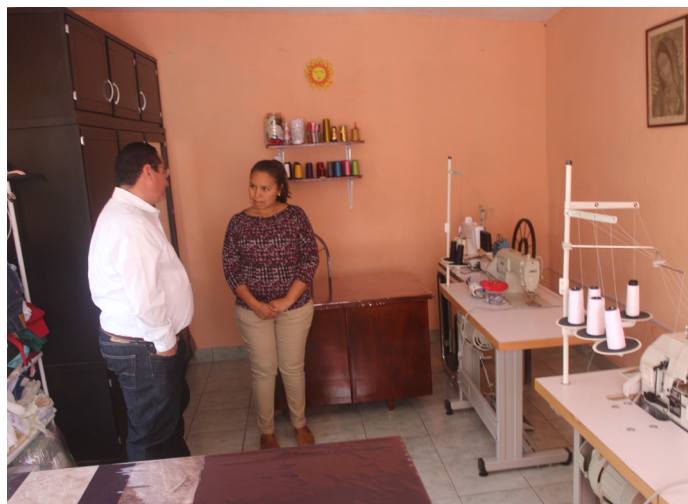
Foto: Apoyo a proyecto de autoempleo

• Se apoyaron 6 proyectos de "Fomento al Autoempleo", destinando a ello $154,313.35, beneficiando a 8 familias.