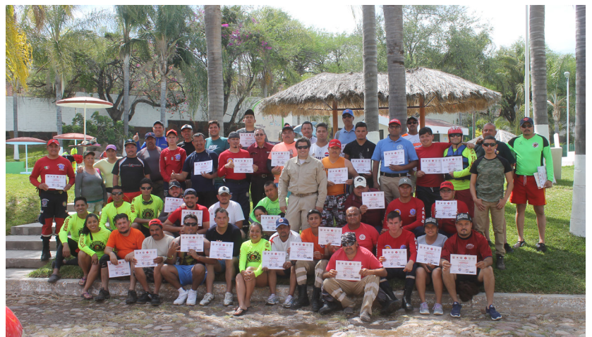
Foto: Curso Básico de Rescate y Salvamento Acuático

• Manejo y Control de Emergencias con Materiales Peligrosos. Impartido por HESCA.