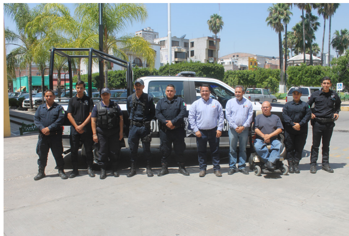
Foto: Entrega de patrulla

• Adquisición de una patrulla, Marca Ford Lobo Modelo 2017.