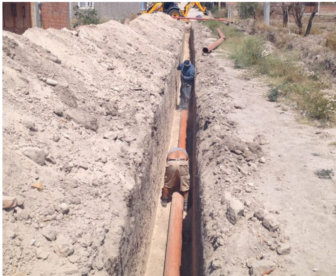
Foto: Rehabilitación de alcantarillado

las alcantarillas así como las redes y descargas de alcantarillado sanitario, invirtiendo un monto anual aproximado a $620,000.00, beneficiando a toda la población.