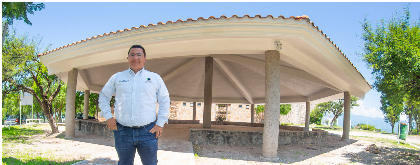
Foto: Rehabilitación de área turística del Santuario