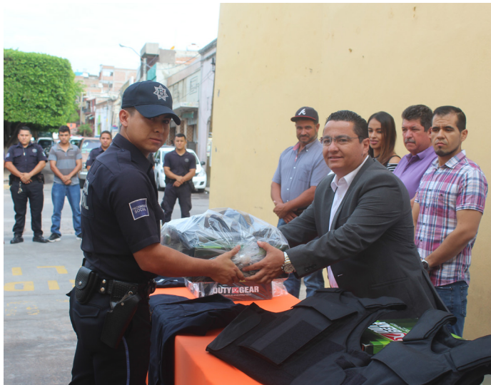
Foto: Entrega de uniformes

botas de piel, camisola, pantalón, gorra tipo beisbolera, chamarra y una playera, todo de la marca 5.11.