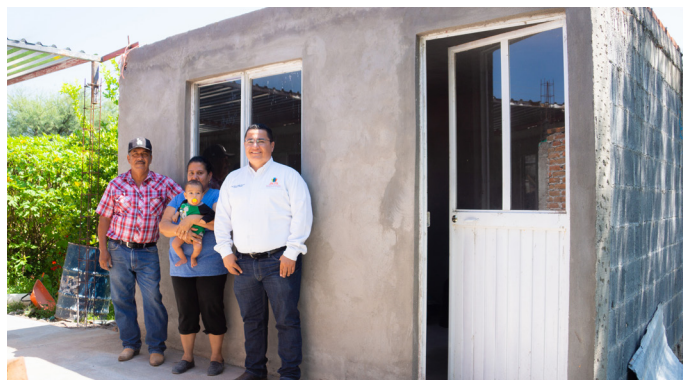
Foto: Cuartos Adicionales

• Ejercimos 170 acciones de vivienda, del tipo Cuartos Adicionales, Baños Dignos y Techos Firmes, beneficiando a igual número de familias, con una inversión de $6'079,642.00.