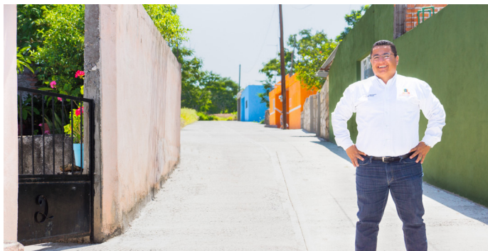
Foto: Construcción de calle en Tuitán