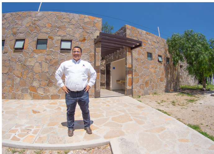
Foto: Rehabilitación de área turística del Santuario

• Con el objetivo de hacer de nuestro Santuario a la Virgen de Guadalupe, un lugar más cómodo para visitar, en todo el año, y dar pie a la explotación turística del recinto religioso más importante de nuestro municipio, invertimos recursos por $2'000,000.00, en conjunto con nuestros hermanos migrantes, para la construcción de la segunda etapa de rehabilitación de dicho espacio.