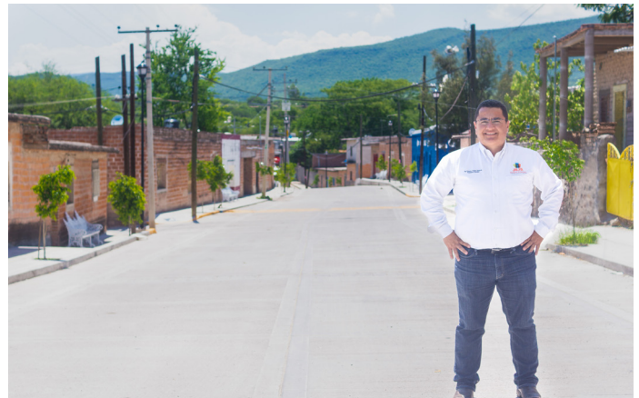
Foto: Pavimentación en la Comunidad de Guadalupe Victoria