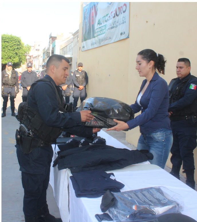
Foto: Entrega de equipo táctico

• Entregamos también equipo táctico compuesto por: tres cascos balísticos nivel 3 A, cinco toletes y 11 fornituras completas.