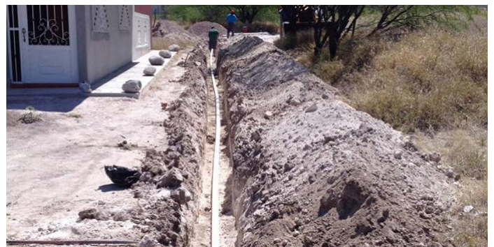
Foto: Rehabilitación y ampliación de redes de agua