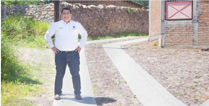
Foto: Pavimentación con concreto ecológico en San Bernardo