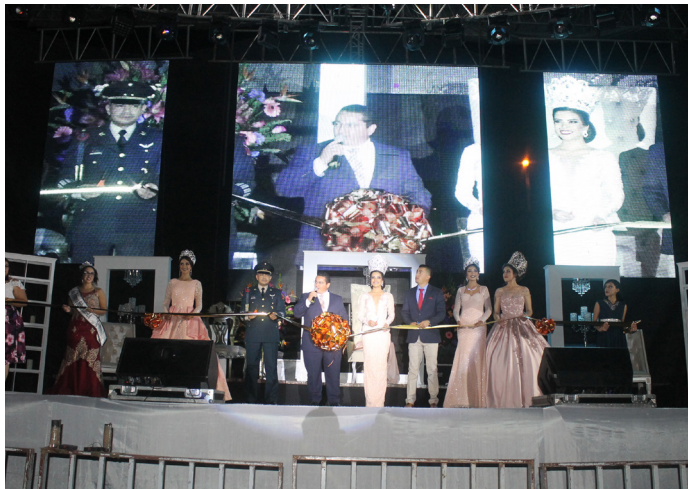
Foto: Feria Regional Jalpa 2017