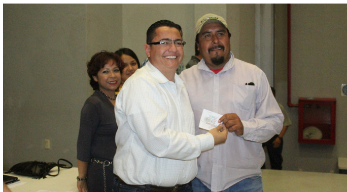
Foto: Entrega de vales de útiles escolares

El ayuntamiento cuenta con finanzas sanas, situación que ha sido reflejada en los distintos estados financieros, así mismo la autorización de la Legislatura del Estado, para que el municipio contratara un crédito con BANOBRAS por $6'000,000.00, el cual no fue utilizado a fin de no comprometer las finanzas de las próximas administraciones.