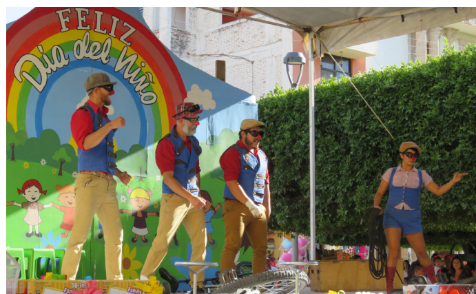
Foto: Día del Niño