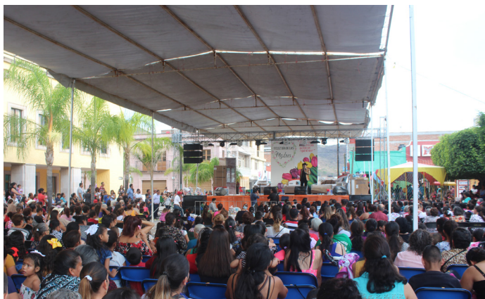
Foto: Día de las Madres