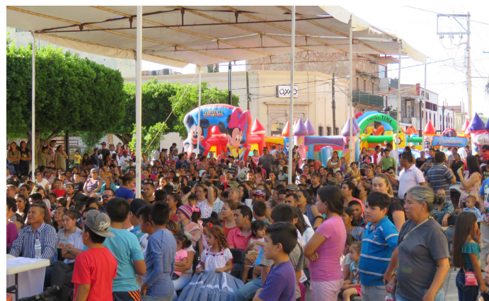
Foto: Día del Niño

Además se presentó un Show de Circo y también hubo una persona en Zancos, en el evento realizamos la rifa de 20 Tabletas Electrónicas, 20 Bicicletas, 10 patines del diablo y 6 avalanchas.