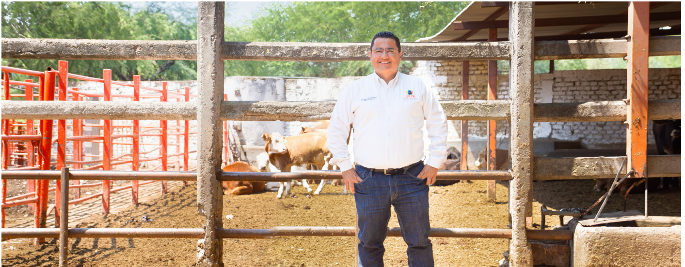
Empedrado de corrales en la ganadera local