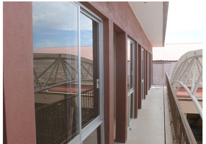
Foto: Rehabilitación de la Casa de la Cultura