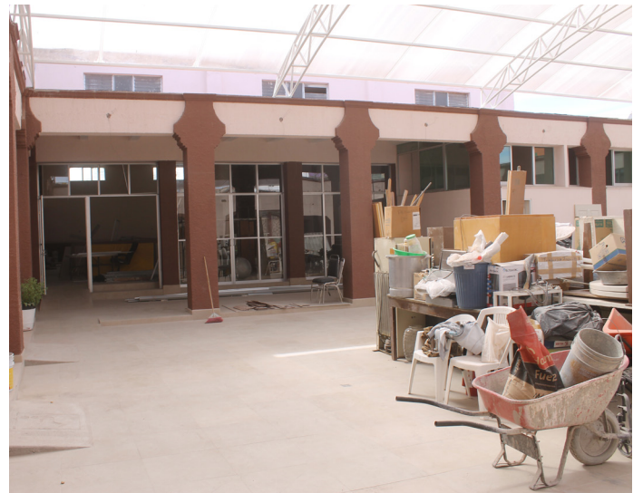
Foto: Rehabilitación de la Casa de la Cultura