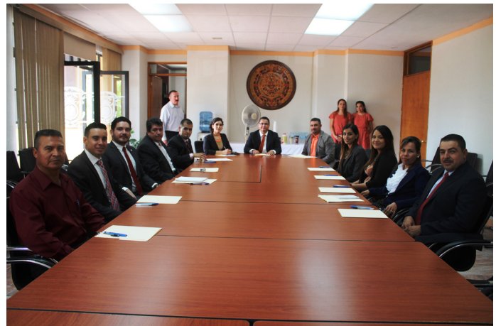
Foto: Sesión de Cabildo