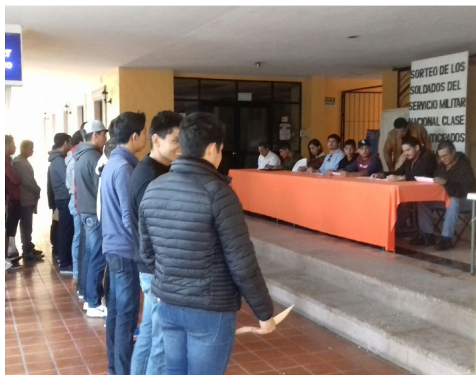
Foto: Sorteo del Servicio Nacional Militar