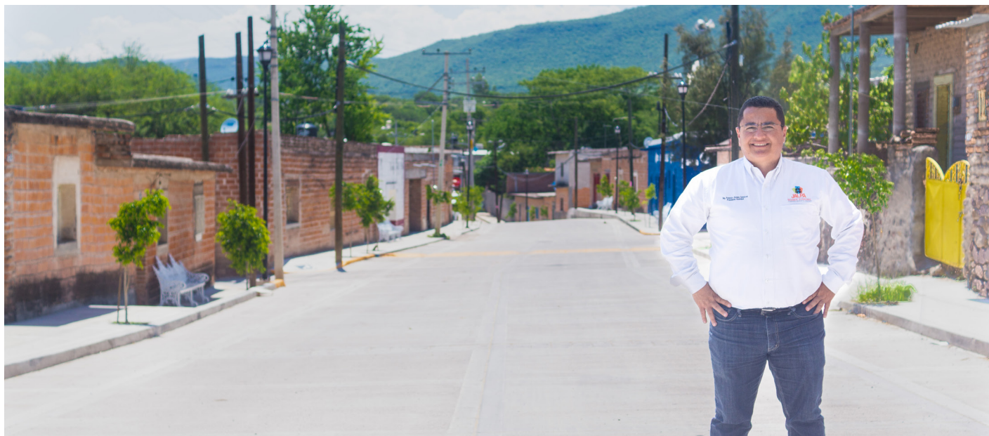
Foto: Rehabilitación de Calle Democracia en Guadalupe Victoria “La Villita”