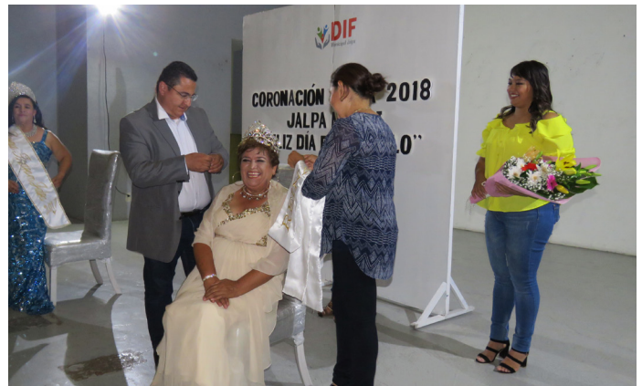
Foto: Coronación reina del INAPAM 2018

En el INAPAM en Jalpa, hemos atendido a este importante sector de la población, mediante diversas acciones que involucran la sana convivencia entre las personas que han entregado su vida al desarrollo de nuestro pueblo.