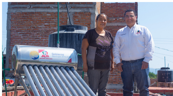
Foto: Calentadores Solares

• Entregamos un total de 596 calentadores solares, incluyendo su instalación beneficiando con ello a 727 familias, con una inversión de $4'603, 708.70.