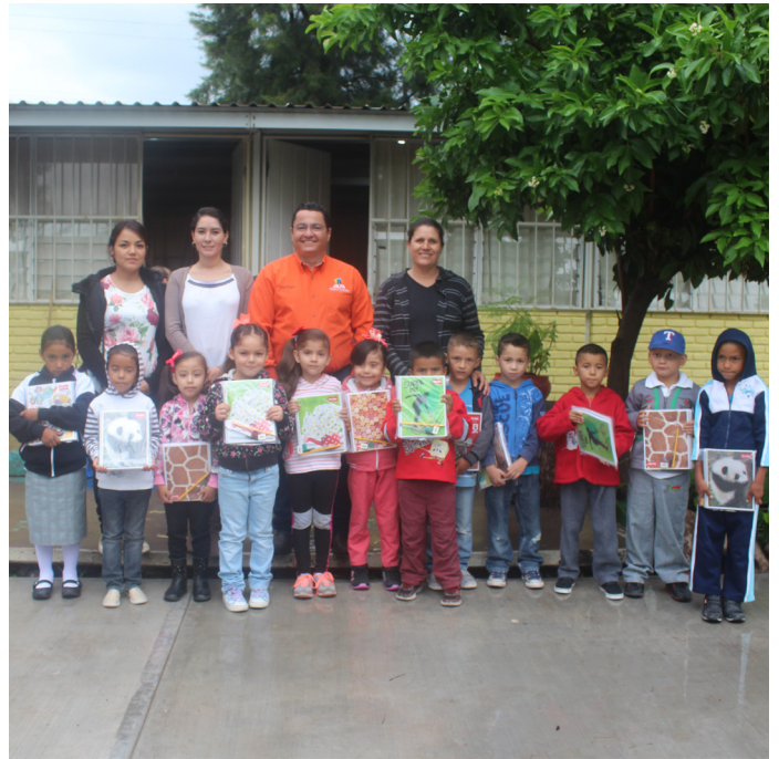
Foto: Entrega de paquetes de útiles escolares