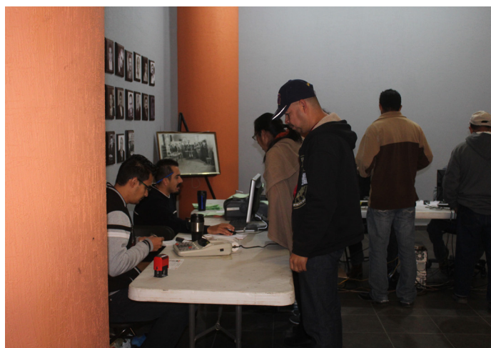
Foto: Pago oportuno del Impuesto Predial

Cabe señalar que año con año, nos hemos distinguido por apoyar a la ciudadanía, aplicando incentivos en el pago oportuno del Impuesto Predial, durante los meses de enero y febrero se ha aplicado el 15% de descuento y un 10% en el mes de marzo.