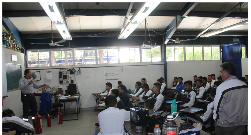
Foto: Capacitaciones en materia de Protección Civil a Guarderías e Instituciones Educativas y Gubernamentales